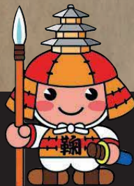
鞠智城 イメージキャラクター ころろ君