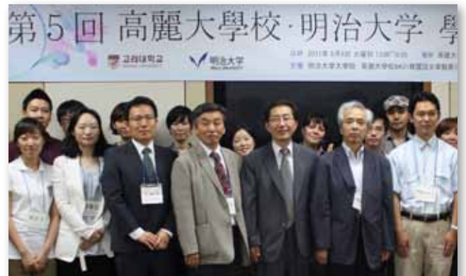
2011年度 高麗大学校プログラム ＜第5回高麗大学校・明治大学 学術交流行事＞より